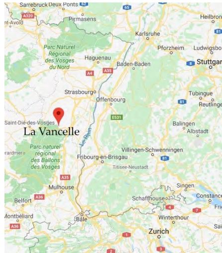
Où c'est exactement