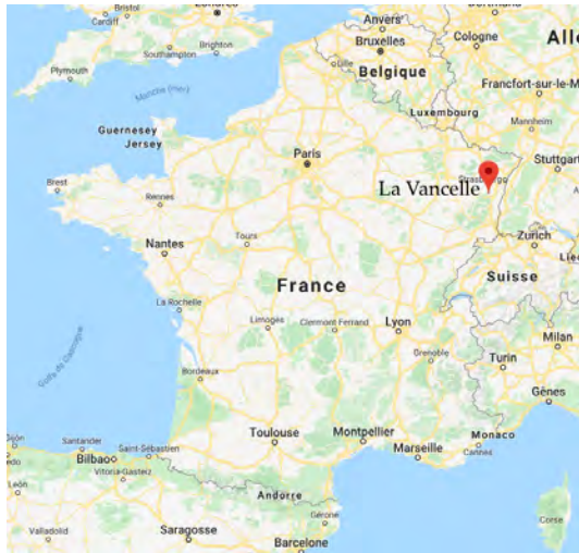
Où c'est en France

Lieu de projet : La Vancelle est un beau petit village entouré de petites montagnes. Il n'y a pas de magasins dans ce village mais il y a deux restaurants célèbres dont un avec une étoile Michelin.